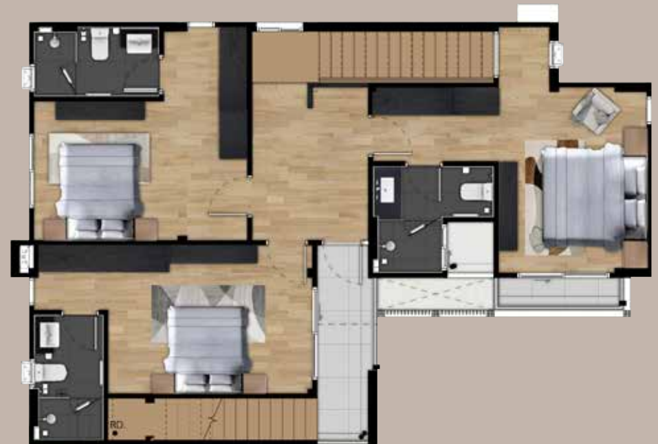
2 nd floor