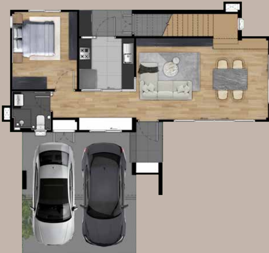
1 st floor