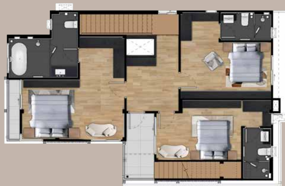
2 nd floor