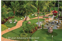
• Phuket Adventure Mini Golf