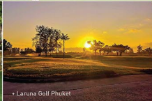
• Laruna Golf Phuket