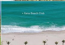
• Xana Beach Club