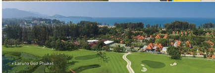
• Laruna Golf Phuket