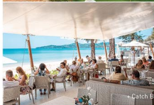
• Catch Beach Club