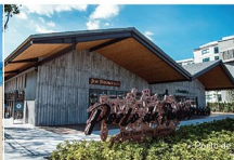
• The Mall Phuket