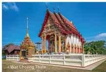
• Wat Choeng Thale