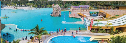
• Blue Tree Water Park